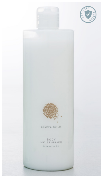
CREMA HIDRATANTE 380 ml e 12.8 fl. oz. FLR400BLGG

LA CREMA CORPORAL HIDRATANTE GENEVA GUILD ESTÁ ENRIQUECIDA CON VITAMINA E Y MANTECA DE KARITÉ Y SE ABSORBE FÁCILMENTE PARA RESTABLECER LA ELASTICIDAD DE LA PIEL Y REGALAR UNA HIDRATACIÓN DURADERA.