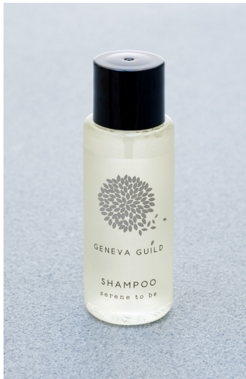
CHAMPÚ 30 ml e 1.01 fl. oz. P30SGG

* Esta crema aumenta la hidratación en más de un +19,3% después de 60 minutos, dejando la piel hidratada incluso pasadas las 24 horas (+9%)