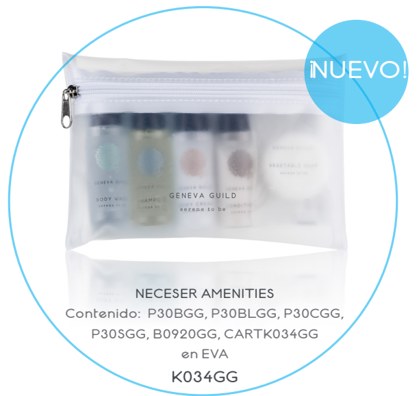
NECESER AMENITIES Contenido: P30BGG, P30BLGG, P30CGG, P30SGG, B0920GG, CARTK034GG en EVA K034GG