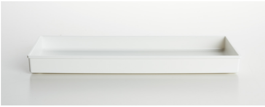
BANDEJA EXPOSITORA PARA AMENITIES de ABS blanco mate I035ABS