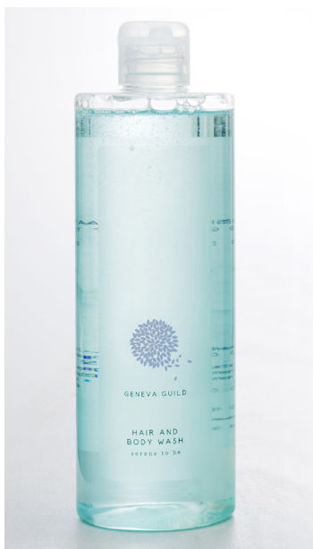
GEL-CHAMPÚ 380 ml e 12.8 fl. oz. FLR400MGG

GENEVA GUILD GEL DE BAÑO Y CHAMPÚ LAVA DELICADAMENTE DE LA CABEZA A LOS PIES. SU FÓRMULA LIGERAMENTE PERFUMADA ESTÁ ENRIQUECIDA CON EXTRACTOS DE ANÍS VERDE Y DE MELISA ORGÁNICOS, DE PROPIEDADES PURIFICANTES.