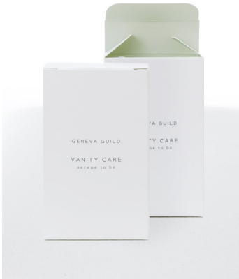
SET HIGIÉNICO en estuche de cartón DE02MAGG