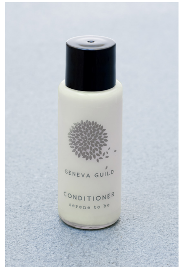
ACONDICIONADOR 30 ml e 1.01 fl. oz. P30CGG

dermatológicamente testado sin siliconas