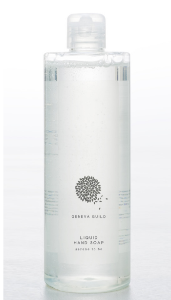
JABÓN LÍQUIDO 380 ml e 12.8 fl. oz. FLR400LMGG

dermatológicamente testado sin siliconas sin aceites minerales