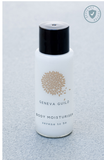
LECHE CORPORAL 30 ml e 1.01 fl. oz. P30BLGG

LA CREMA CORPORAL HIDRATANTE GENEVA GUILD ESTÁ ENRIQUECIDA CON VITAMINA E Y MANTECA DE KARITÉ Y SE ABSORBE FÁCILMENTE PARA RESTABLECER LA ELASTICIDAD DE LA PIEL Y REGALAR UNA HIDRATACIÓN DURADERA.