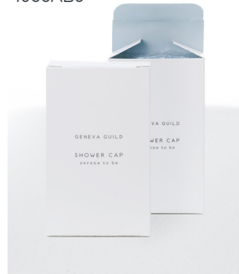
GORRO PARA DUCHA en estuche de cartón C02MAGG