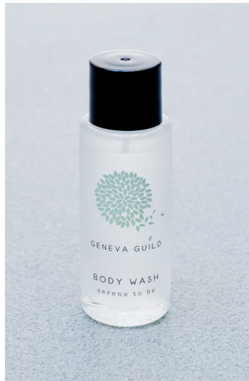
GEL DE DUCHA 30 ml e 1.01 fl. oz. P30BGG

EL GEL DE BAÑO GENEVA GUILD LIMPIA DELICADAMENTE LA PIEL. SU FÓRMULA DE AROMA LIGERO CONTIENE EXTRACTO DE ALOE VERA CON PROPIEDADES EMOLIENTES Y SUAVIZANTES.