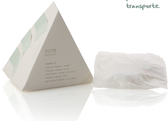
NECESER PIRAMIDAL PARA KIT AMENITIES en caja de papel K045PSM

CAJA PIRAMIDAL se entrega plana a fin de optimizar el volumen para reducir el consumo durante las operaciones de logística y transporte.