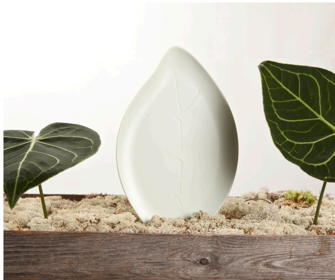
BANDEJA EXPOSITORA CON FORMA DE HOJA EN ABS I045SM