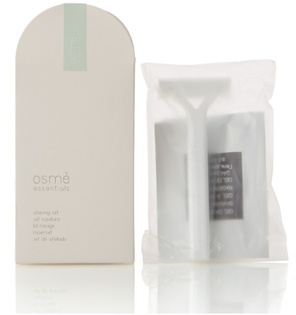
SET DE AFEITADO en caja de papel E0114SM