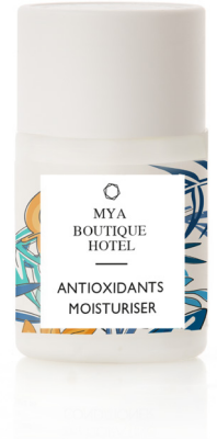
PERSONALIZACIÓN CON LOS MISMOS COLORES DE LA GAMA STANDARD