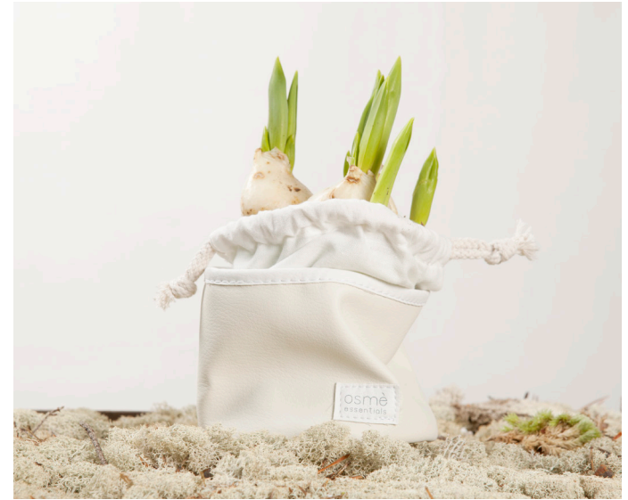
NECESER ESSENTIALS K075VSM