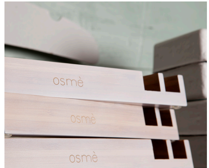
BANDEJA EXPOSITORA EN MADERA DE BAMBÚ I075SM