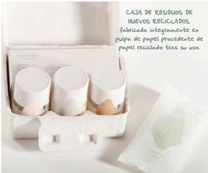
CAJA DE REGALO 'EGGBOX' K065SM