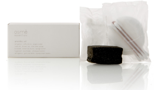
KIT ACOGIDA en caja de papel K045SM