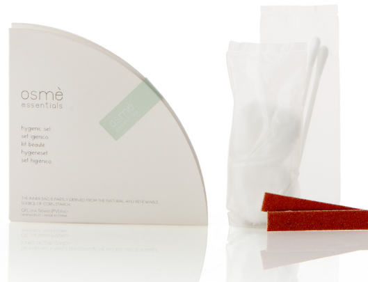
SET HIGIÉNICO en caja de papel DE024SM

CAJA DE PAPEL Bolsas interiores, procedentes parcialmente de fuentes naturales y renovables de almidón de maíz.