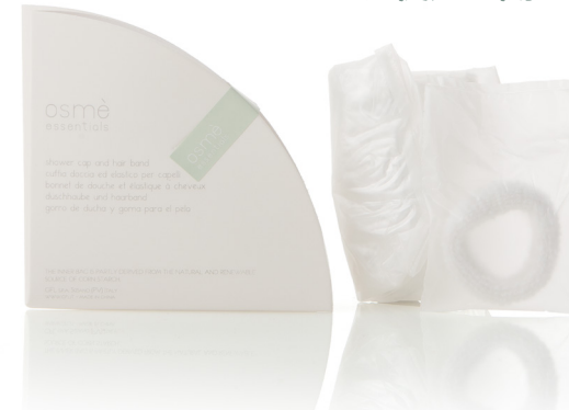
GORRO DE DUCHA Y GOMA PARA EL PELO en caja de papel C024SM

CAJA DE PAPEL Bolsas interiores, procedentes parcialmente de fuentes naturales y renovables de almidón de maíz.