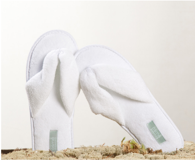
CHANCLAS EN ALGODÓN SUPER SUAVE F085SM