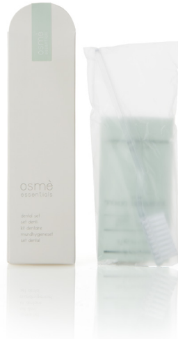
SET DENTAL en caja de papel E094SM