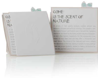
ETIQUETA DE PRESENTACIÓN SCR2SM