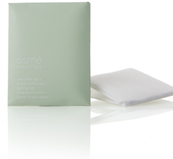
GUANTE LIMPIA ZAPATOS en caja de papel F03SM